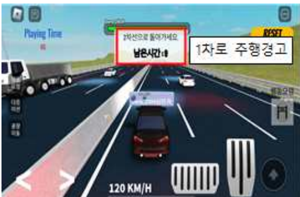
미션 : 추월차로 지속운행 금지