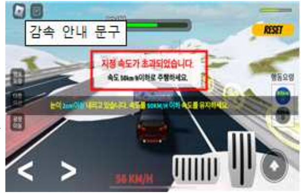
미션 : 악천후(눈) 감속주행