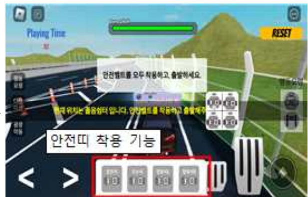
미션 : 전좌석 안전띠 착용