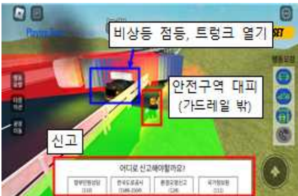
미션 : 안전한 곳으로 우선대피 후 신고