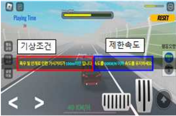
미션 : 악천후(비) 감속주행