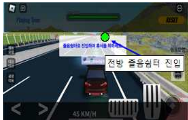
미션 : 졸음시, 졸음쉼터 이용